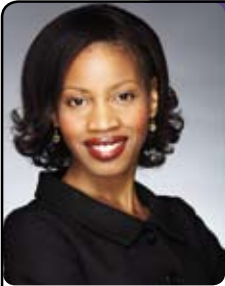
Yolande James Ministre de l'Immigration et des Communautés culturelles